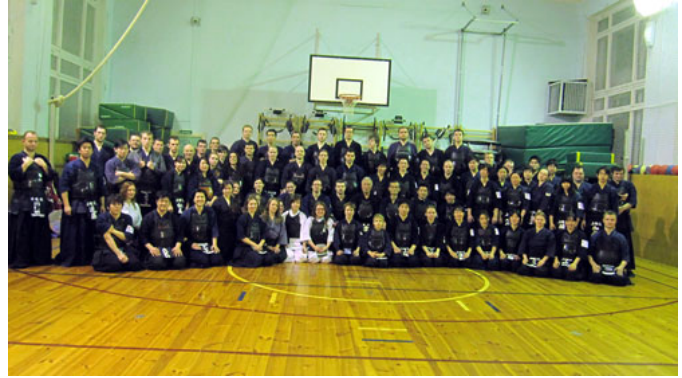
二日目の全体写真

なることを私は期待したい。また関係者のご協力なくしては本事業成功をおさめることはできませんでした。尽力をくださったすべての方々に深く御礼申し上げます。