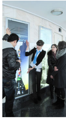
ガイドによる案内