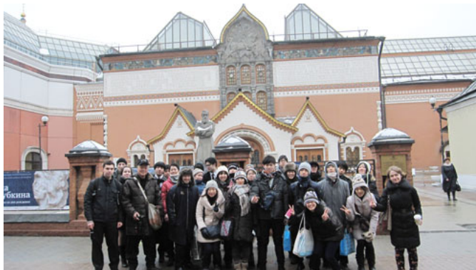
トレチャコフ美術館

アルバート通りでは観光客向けの多くのお土産屋が見られた。ソチオリンピックもあることから、五輪について外国人向けの取材を受けた団員もいた。一通り視察したのち、アエロエクスプレスで空港へ向かった。また荷物を預ける際に超過荷物が出てしまい100ユーロ支払った。アエロフロートに勤めている剣道家が同行してくれ交渉してもらったが、テロの影響から警備等が厳しくなっており、交渉には応じてもらえなかった。離陸は時間通りであり、到着も遅れることはなかった。出国、入国ともにスムーズに出来、荷物のピックアップも問題なく、ロストバゲージもなかった。