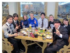
さよならパーティーの様子

試合終了後レストランに移動し、さよならパーティーに参加した。料理を楽しみながら各々が友好の輪を広げた。さよならパーティー終了後24:00にホテルに戻った。