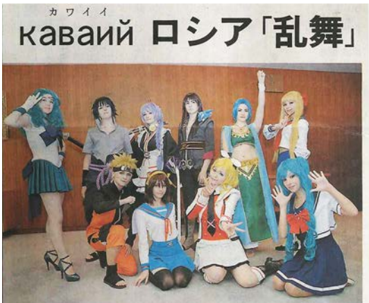
ポーズを取るロシア人のコスプレイヤーたち=札幌市役所 朝日27.10.12