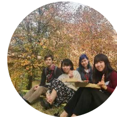
В Токийском университете международных исследований