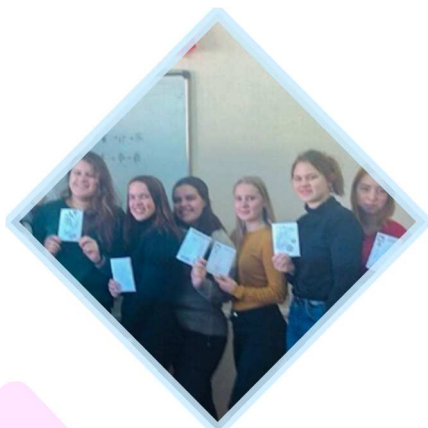
Мы сами сделали новогодние открытки!