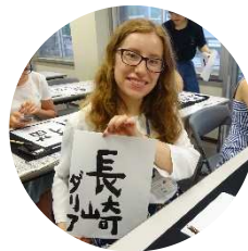
Кружок каллиграфии в Университете Нагасаки