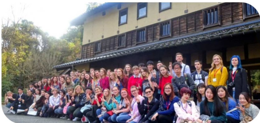
Со студентами Университета Канадзава

В Университете Канадзава мы сделали презентацию о своем родном крае и много разговаривали на японском языке.