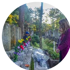
Русское кладбище в Нодаяма

Были проведены встречи и культурные мероприятия в Университете Канадзава в префектуре Исикава. Состоялось также общение примерно с 50 студентами-русистами из Токийского университета международных исследований в Токио.