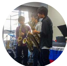
Теплый прием в Лицей при Университете Васэда