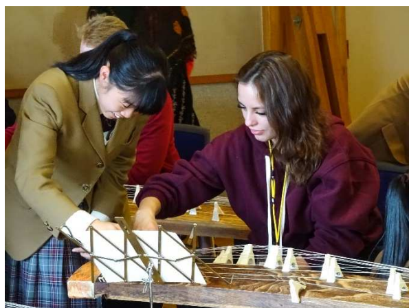
Культурный обмен между Эхимэ и Оренбургом