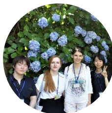
Прогулка по Камакуре

Члены группы посетили Университет Нагасаки, приняли участие в мастер-классах по японской культуре, познакомились с историей взаимоотношений между Нагасаки и Россией, а также прослушали проникновенный рассказ о важности мира одного из хивакуся — очевидцев, переживших атомную бомбардировку.