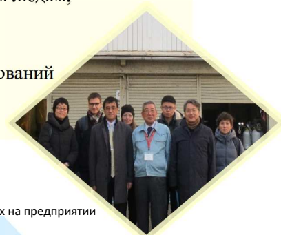
В гостях на предприятии