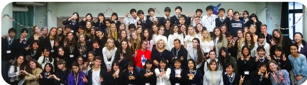
В Киотской префектурной старшей средней школе Хокурё

В Японию были приглашены 52 старшеклассника, изучающих японский язык в различных районах России. Участники программы посетили Киотскую префектурную старшую среднюю школу Хокурё,