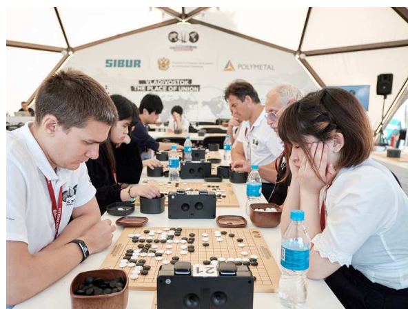
Японо-Российский обмен по Го