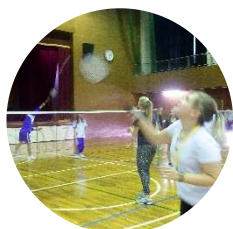
В Токийской префектурной старшей школе Китадзono