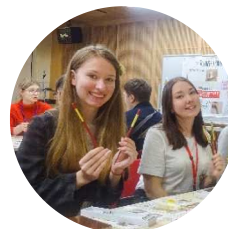
Мастер-класс по наклейке сусального золота